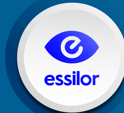
Essilor Especialista Varilux