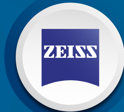
Carl Zeiss Vision Certified Vision Expert

Respaldados por el distintivo Marca GTO® , impulsamos procesos de mejora continua que fortalecen nuestra cultura de calidad, competitividad y productividad. Gracias a ello, nos hemos destacado en el sector empresarial, consolidando un servicio caracterizado por tiempos de respuesta ágiles y confiable.